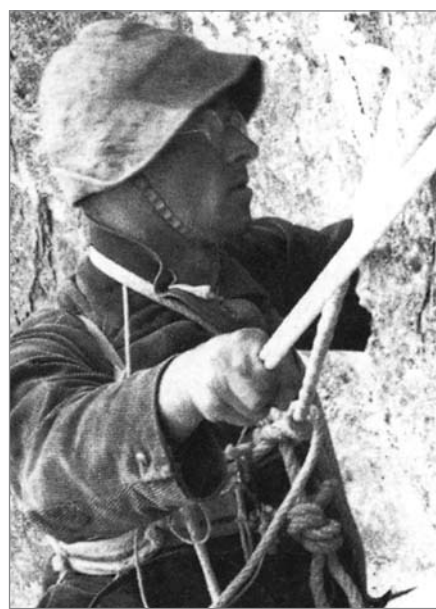
Aus dem Wandbuch der Dachl-Rosskuppenverschneidung