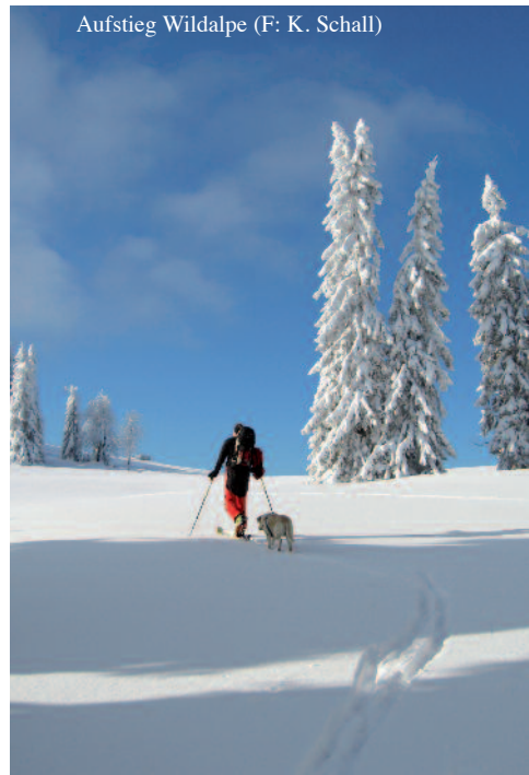
Aufstieg Wildalpe

Mit dem PKW von Frein a.d.Mürz westlich in das weiterführende Freinerbachtal. Zufahrt zumeist bis zum "Gschwandt" (992 m) möglich. Von hier führt eine markierte Forststraße zum Freinsattel (1106 m). Nun rechts in östlicher Richtung weiter der Sommermarkierung folgend zu schönen Almböden und zur Kammhöhe, über welche man zum Gipfel gelangt.