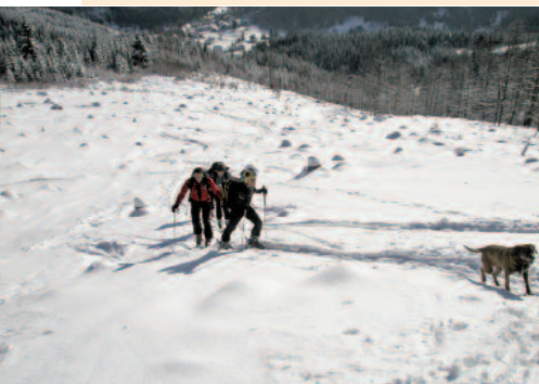
Aufstieg von Frein zur Wildalpe

Anreise: von Mürzzuschlag in das obere Mürztal und über Neuberg a.d. Mürz nach Mürzsteg. Hier Abzweigung rechts nach Frein a.d.Mürz (am besten beim Ghf. Freinerhof parken). Anreise zu den anderen Ausgangspunkten siehe bei den Aufstiegsbeschreibungen.