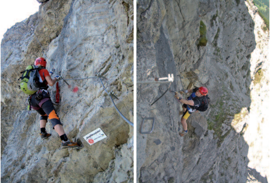
Die "Bergführerplatte" (Schlüsselstelle, C)

Abstiege: 1 - 2,5 Std. a) Auf dem Normalweg (Weg 76) zurück zum Iseler (Panoramaweg) und hinunter zur Bergstation (1 Std.; 300 Hm; kurzer Gegenanstieg); b) nach Süden über die Zipfalsalpe (1534 m) nach Hinterstein (866 m; 2,5 Std.; 990 Hm). Für diese Variante müsste man mit dem zweiten Auto oder öffentlichen Bus zurück zur Talstation gelangen; c) nach Norden über den Kühgundrücken (tw. gesichert, A) und am Wanderweg zur Wiedhagalpe (1425 m) und gemütlich hinab zur Talstation (2,5 Std.; 720 Hm). Hierbei handelt es sich zum Teil um einen alten Schmugglerweg.