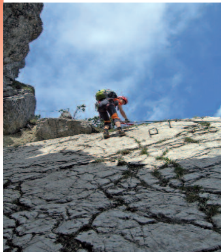
Teil 2 Salewa-Klettersteig (Plattenrampe)