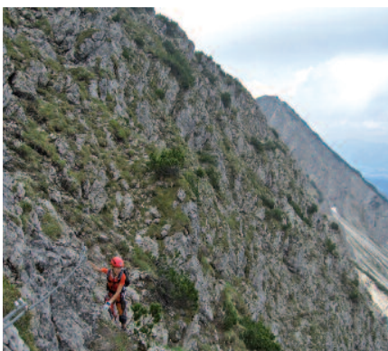
Unterwegs im Teil 3 des Salewa-Klettersteiges