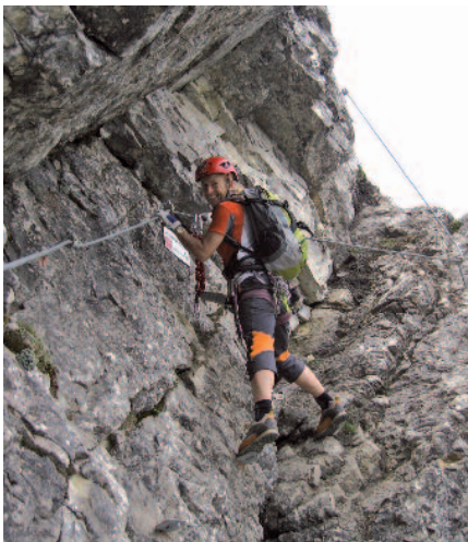
Teil 2 Salewa-Klettersteig ("Schusterplatte")