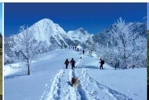
Am Kl. Bosruck