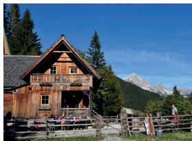
Ardning Alm Hütte