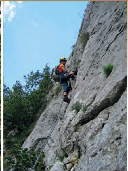
Oben links: Einstieg Hetschi-Klettersteig ; oben rechts: Karin-Klettersteig ; unten links: Trattenbacher-Klettersteig ; Mitte: Großalber-Klettersteig ; unten rechts: Mammut-Klettersteig (alle Fotos: K. Schall)