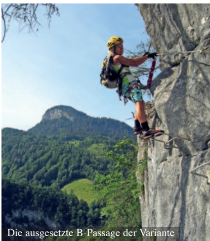
Die ausgesetzte B-Passage der Variante

Steigverlauf: Siehe Topo. Die Abzweigung zur etwas schwereren Var. Angst & Fürchti befindet sich nach den ersten Wandstufen bei der Hinweistafel und führt zu Beginn rechts